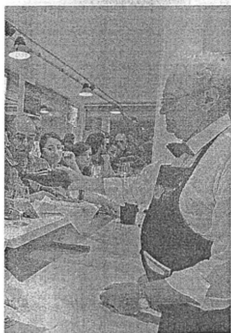
to dell'Enofila, sede della Douja d'Or

ta in numeri e qualità" serate gastronomiche